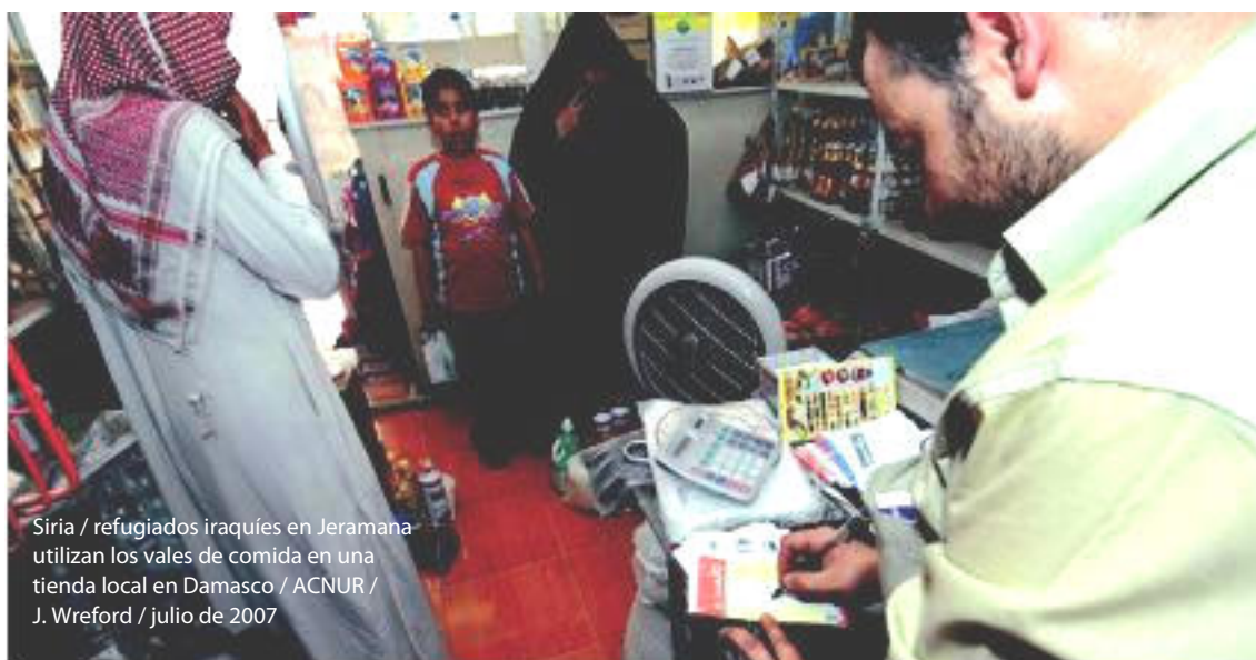
Siria / refugiados iraquíes en Jeramana utilizan los vales de comida en una tienda local en Damasco / ACNUR / J. Wreford / julio de 2007

Las ayudas en efectivo, siempre que sea posible, son a menudo una forma más digna de asistir a las poblaciones afectadas, ya que empodera a las personas para determinar sus propias necesidades y la mejor manera de satisfacerlas. También pueden promover la coexistencia pacífica con las comunidades de acogida, ya que las ayudas en efectivo bien diseñadas y ejecutadas tienen un efecto multiplicador, beneficiando directamente a la economía local.